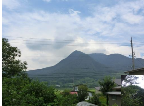
↑ 物件敷地から見える風景