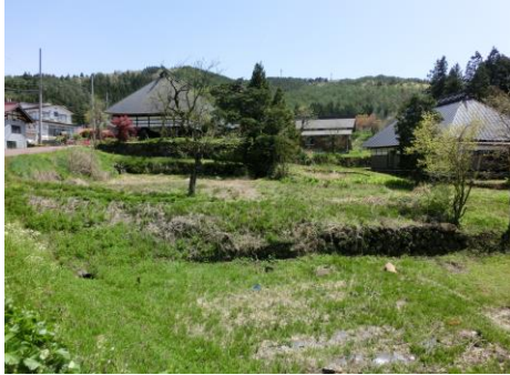
↑ 物件敷地から見える風景