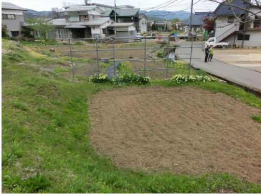
↑ 物件敷地から見える風景